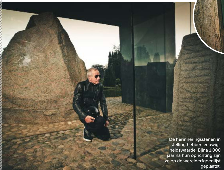
De herinneringsstenen in Jelling hebben eeuwigheidswaarde. Bijna 1.000 jaar na hun oprichting zijn ze op de werelderfgoedlijst geplaatst.