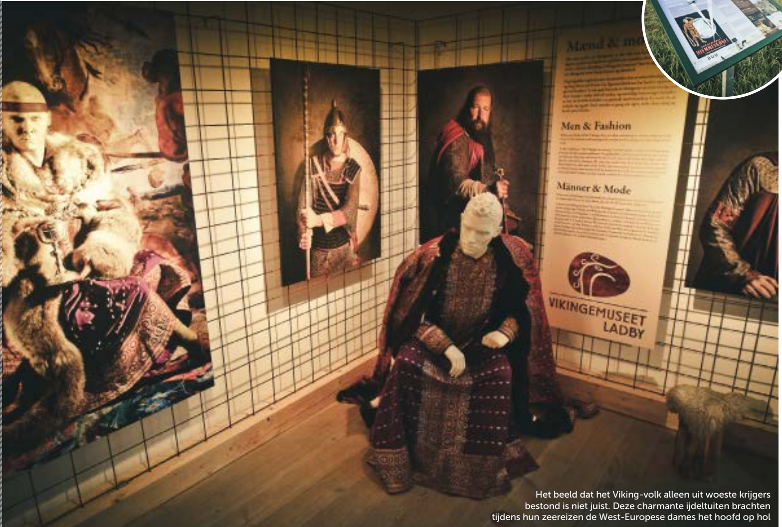
Het beeld dat het Viking-volk alleen uit woeste krijgers bestond is niet juist. Deze charmante ijdeluiten brachten tijdens hun zeereizen de West-Europese dames het hoofd op hol

functie van de heuvel is een hardstenen sokkel die we midden op de groene heuvel treffen. Een plaquette uit de 19e eeuw vermeldt dat één meter rondom de steen altijd beschikbaar moet blijven voor militaire doeleinden. Waarvan akte.