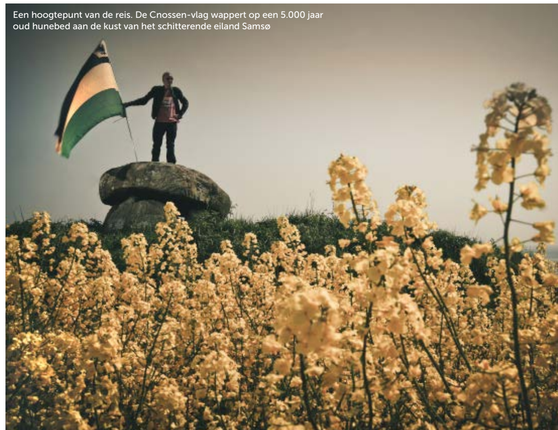
Een hoogtepunt van de reis. De Cnossen-vlag wappert op een 5.000 jaar oud hunebed aan de kust van het schitterende eiland Samsø

We hebben niet al te veel tijd voor emotionele mijmeringen, de boot wacht! De volgende stop is op Samsø, een prachtig eilandje dat ligt ingeklemd tussen zijn grote broers Jutland en Funen. Het staat bekend om de ecologisch verantwoorde economie. Door windenergie en koolzaadolie wil het eiland voorzien in zijn eigen energiebehoefte. Op de fraaie kronkelweggetjes tussen de heggen door is het heerlijk motorrijden. We treffen het met de gekozen reisperiode. In mei geven de paarse seringen, het knalgele koolzaad en de bloedrode huizen een bijzondere couleur locale. Wat een perfecte manier om op zoek te gaan naar de volgende stop. Jelle: 'Langs de kust in het Zuid-Oosten van Samsø ligt