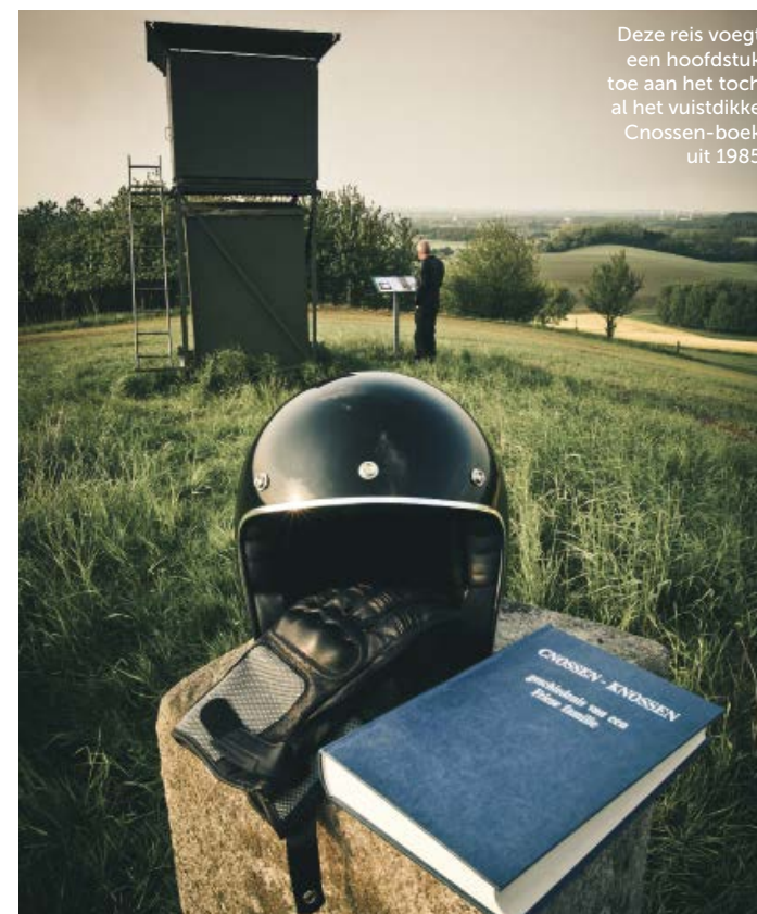
Deze reis voegt een hoofdstuk toe aan het toch al het vuistdikke Cnossen-boek uit 1985

lende administraties, waar we niet alleen individuen, maar ook familieverbanden vinden. Over een burgemeester wordt nu eenmaal meer geschreven dan over een putjesschepper.' Maar hoe zit het dan met die Vikingen in de familie? 'Het Deense rijk was vroeger enorm, ook Zweden hoorde erbij. De connecties tussen Noord-Nederland en Denemarken waren erg goed. De taal is verwant. Ik ben van geboorte Fries en kan het moderne Deens tot op zekere hoogte prima lezen. De Friezen stonden bekend om hun zeemanskunsten en handelsgeest. De Vikingen maakten graag gebruik van Friese schippers voor handelsmissies. We zien Vikingen vooral als brute plundersaars met horentjes op hun kop, maar in werkelijkheid stonden ze in West-Europa bekend om hun ijdelheid en mooie kleren. Ze gingen twee keer per week in bad, dat was uniek. Ik kan me best voorstellen dat er een Friese meid een leuke Viking aan de haak heeft geslagen. Wie weet komen we dat nog eens te weten, maar ik denk dat die kans erg klein is.'