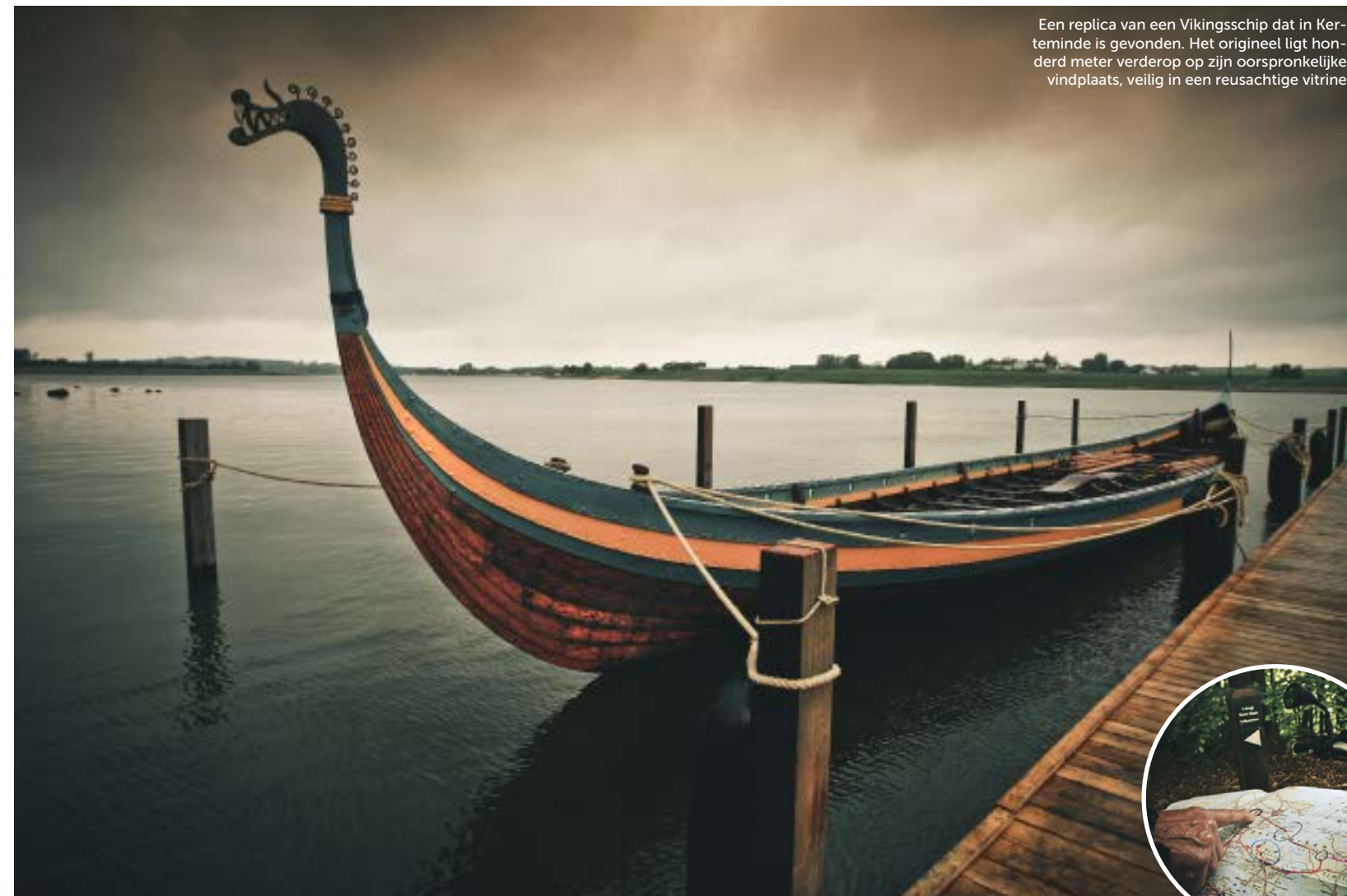
Een replica van een Vikingschip dat in Keremunde is gevonden. Het origineel ligt honderd meter verderop op zijn oorspronkelijke vindplaats, veilig in een reusachtige vitrine